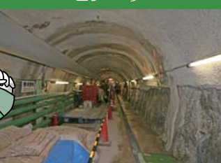
深度300m研究アクセス坑道

瑞浪超深地層研究所では、毎月1回（原則第4日曜日）、施設見学会を開催しています。この施設見学会では、地下300mの世界を体験することができます。