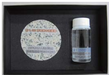
2万人達成の記念品

瑞浪超深地層研究所では、実際に地下の世界を体験していただく施設見学会を毎月1回開催しています。是非、ご参加ください（見学会の詳細は、右欄の記事と裏面をご参照ください）。